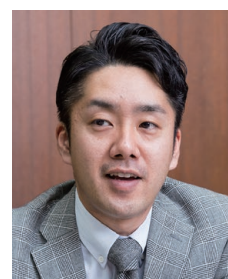
ワイジェイカード株式会社 信用企画部 信用企画グループ マネージャー