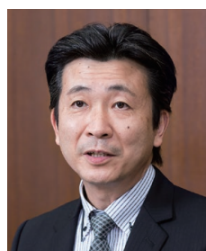
ワイジェイカード株式会社 信用企画部 部長

新たなスコアリングモデル・与信ルールによって審査の精度や成果が可視化され、客観的な数値をもとにした合理性のある審査モデルが確立された。またプロセスの自動化などによって、担当者の負荷は大幅に軽減した。