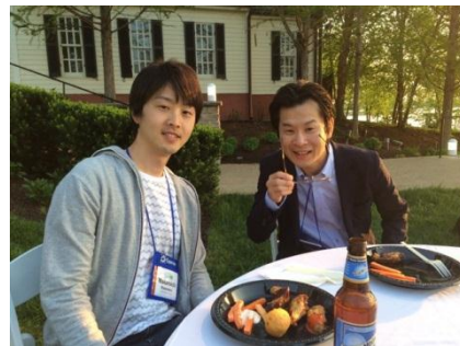
セッション以外に食事やアクティビティでも参加者同士の交流は深まりました