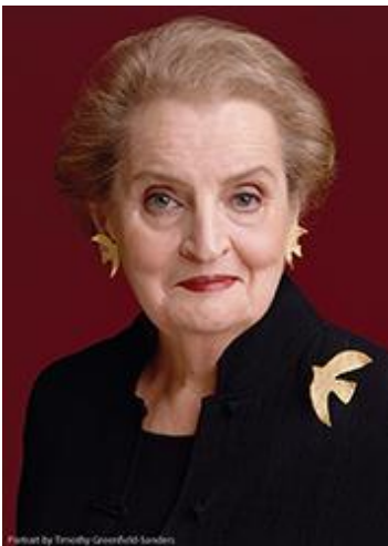
マデレーン・オルブライト氏 (元アメリカ合衆国国務長官 1997-2001)

各界の著名なリーダーをゲストに迎え、General Sessionが開催されました。