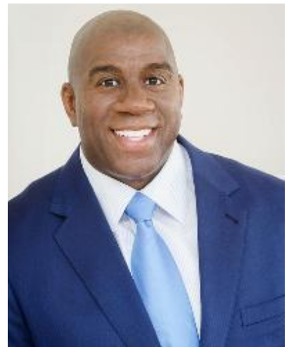
アーヴィン・“マジック”・ジョンソン氏 (バスケットボール殿堂入り選手、 実業家)