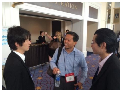
参加者間の情報交換も積極的に行われていました